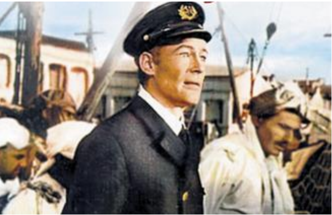
Peter O'Toole i hovedrollen som Jim i Richard Brooks' filmatisering av Conrad-romanen Lord Jim .