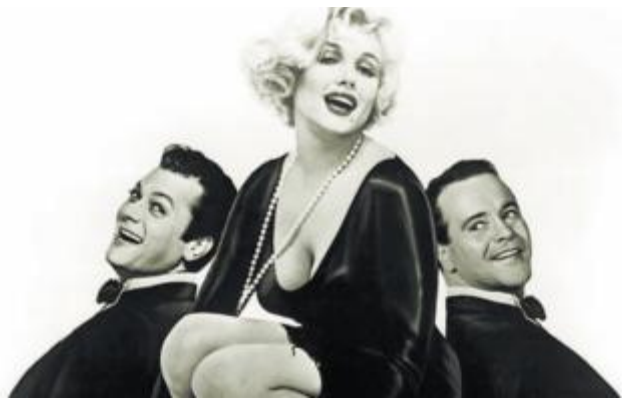
Sugar Kane Kowalczyk (Marilyn Monroe) og hennes to beundrere Joe (Tony Curtis, til venstre) og Jerry (Jack Lemmon) i Billy Wilders elleville Some Like It Hot (1959).