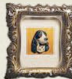
Portrett av Hund (2010)