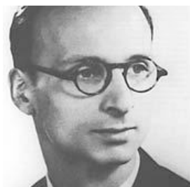
Jehan Alain ble drept av tyskerne i juni 1940, 29 år gammel.