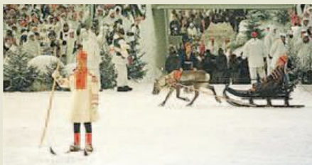
Nils Aslak Valkeapää joiker ved åpningen av OL på Lillehammer 1994.