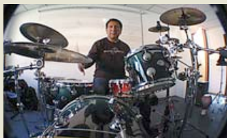
Alex Acuna spiller på Nordlysfestivalen i Tromsø i morgen.