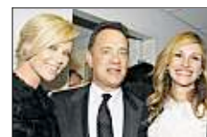
Charlize Theron (t.v.) og Julia Roberts skal nå spille hver sin onde dronning i hver sin «Snehvit»-film, som begge skal ha premiere i 2012. Tom Hanks får derimot ikke være med på noe eventyr.