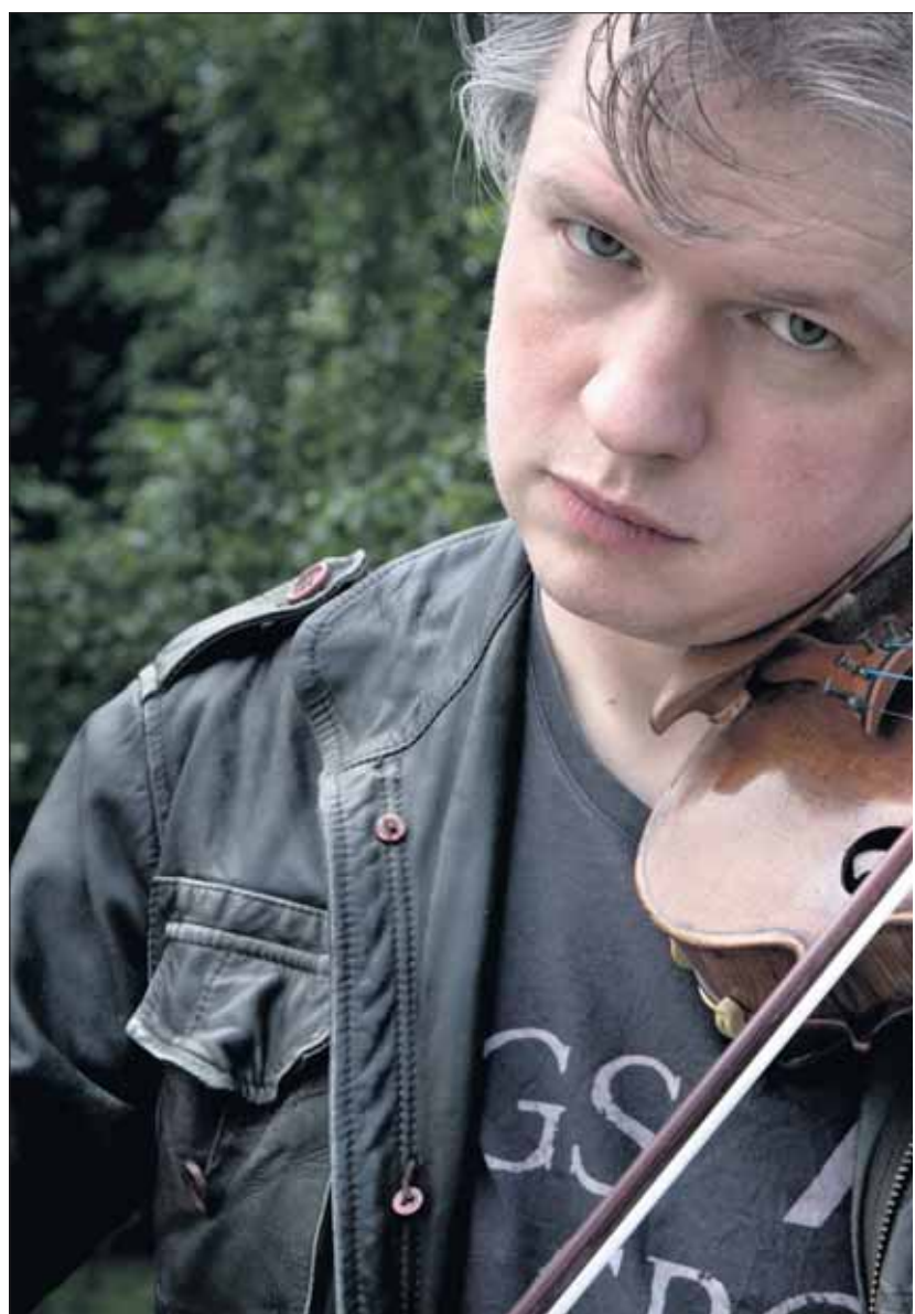
AURA AV MYSTIKK: På spørsmål om mytene rundt felespillerens kraft og nærheten til det mørke,