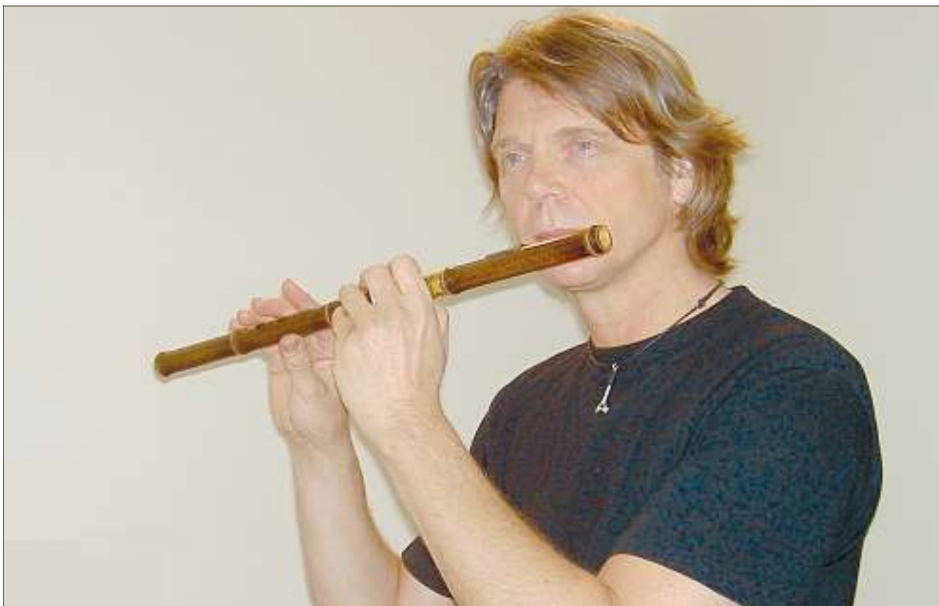
Steinar Ofsdal er norsk musikk allsidig vandringsmann.