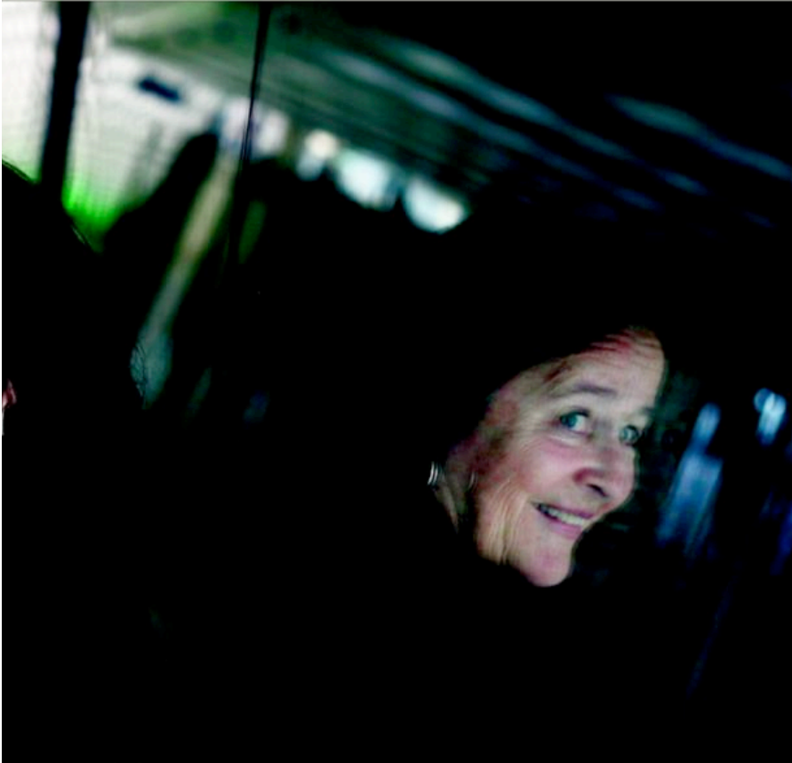
anmelder stor pris på.