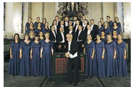
Oslo Domkor lover barokkfest i Halden og Oslo.