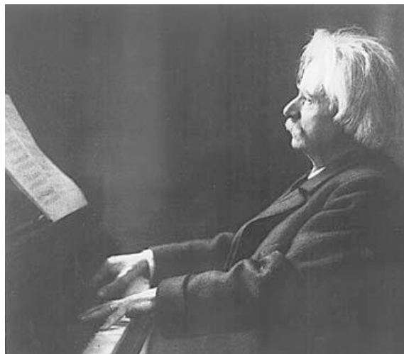
I 1903 gjorde Edvard Grieg noen innspillinger av egen musikk som siden har blitt liggende – utilgjengelig for allmennheten.